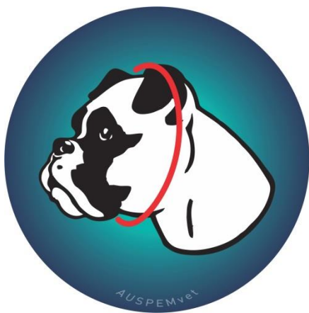
Figura-2 MEDIDA DA CIRCUNFÊNCIA

Tome a medida justa, apertada e sem folgas, desprezando as orelhas. Com a medida, utilize a Tabela 4 e determine o Tamanho e o Código do Produto.